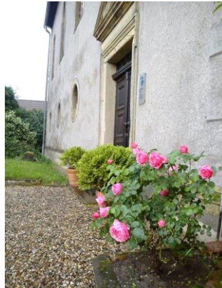
"100-jähriger Rosenstock": Ein Geschenk zum 100sten Frauenhilfsjubiläum 2014 aus Satuelle

Ein großes Dankeschön für die musikalische Gestaltung geht an Gabi Krause, die stets wunderschöne Melodien an der Orgel hervorgezaubert hat.