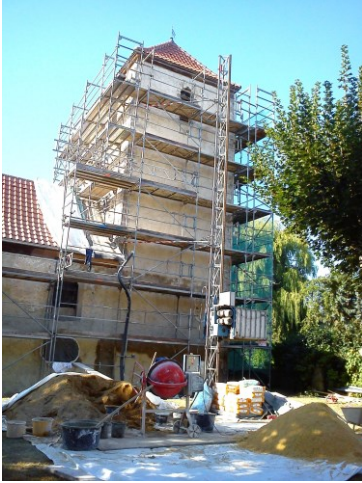
Was ist die alte Dame so schick geworden in ihrem neuen Kleid! Die St. Annen-Kirche von Süplingen 2016 renoviert!