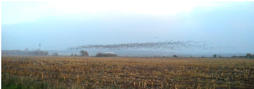
Wildgänse zwischen Bülstringen und Satuelle

Es gibt mehr historische Beweise, dass Jesus von den Toten auferstanden ist, als Beweise dafür, dass Gaius Julius Cäsar je gelebt hat.