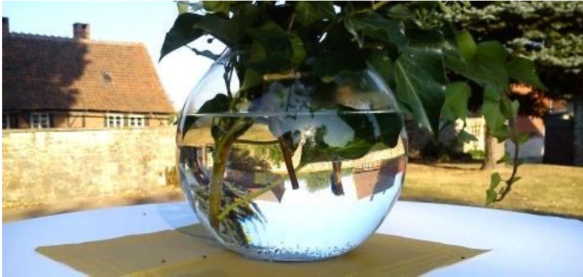
Die Welt steht Kopf in der Blumenvase des Hörsinger Frauenkreises

Der Pfarrer tritt ein, macht eine Verbeugung vor dem Gekreuzigten, spricht ein stilles Gebet. Er wirft einen mahnenden Blick zu den Kindern, die in den vorderen Bänken schwatzen. Ächzend setzt sich der Blasebalg in Bewegung, von Konfirmanden getreten, die Orgel wagt ihre ersten feinen Töne, es folgen die tiefen Bässe.