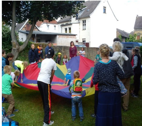
Foto: Zelten zum Schuljahresabschluss 2016 im Süplinger Pfarrgarten